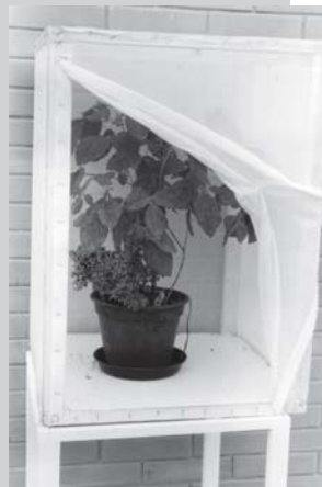
Gaiolas de criação do percevejo da soja