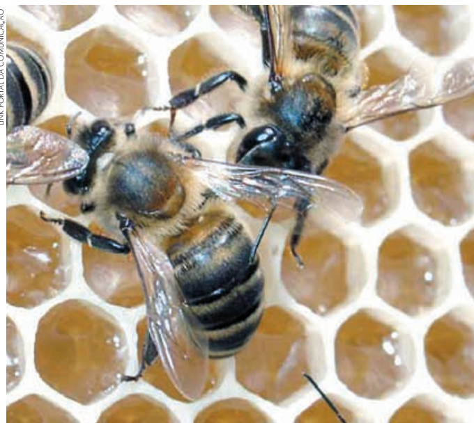
Ao retirar o pólen das flores, as abelhas são responsáveis por sua reprodução