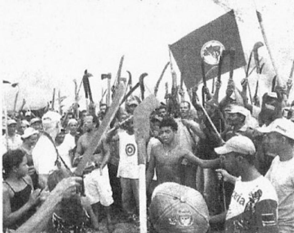
NA MIRA – Ação violenta do MST motivou reação de Mendes

No início de março, com o voto de minerva do corregedor-geral de Justiça, o CNJ aprovou uma "recomendação" a todos os tribunais – proposta pelo ministro Gilmar Mendes – para que "priorizem e monitorem constantemente o andamento de processos envolvendo conflitos fundiários" e "implementem medidas concretas e efetivas objetivando o controle desses an-